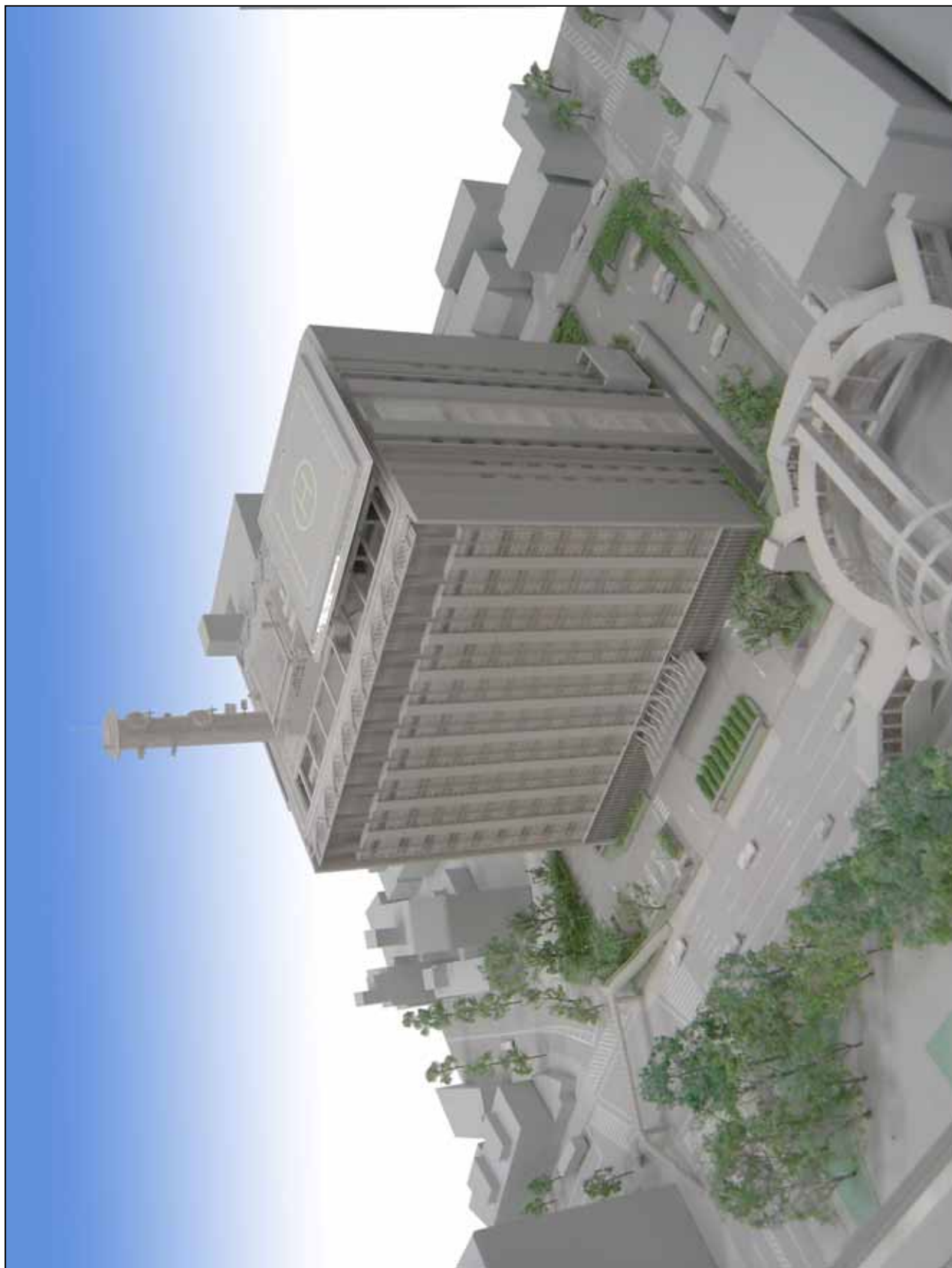
千葉県警察本部新庁舎模型写真