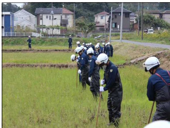
【安否不明者の搜索状況】