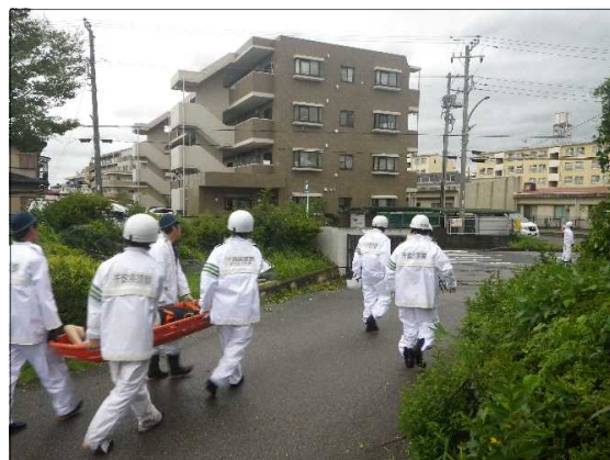
【救出救助活動の状況】