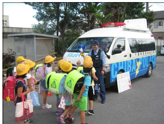
【移動交番による見守り活動状況】