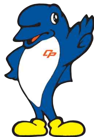
シンボルマスコット シーポック

ち ば けん けい さつ 千葉 県 警 察 しや ち ば けん ぼう はん きょう かい (社) 千葉県防犯協会