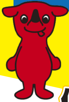
千葉県 マスコットキャラクター チーバくん