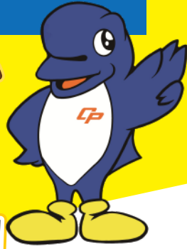
シンボルマスコット シーポック