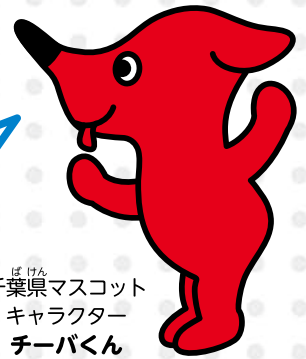
ちばけん 千葉県マスコット キャラクター チーバくん