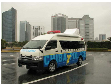
【ワンボックスタイプ】

A 移動交番車は、その名のとおり「動く交番」です。専用の車でお年寄 りや子供たちを見守りながら町中のパトロールをしたり、地域の人た ちがたくさん集まる場所や交番を新しく建ててほしいという場所などに 車を止めて、事件・事故や落とし物の届出を受けたり、みなさんの相談 を聞いたりするなど、交番と同じ活動を行っています。