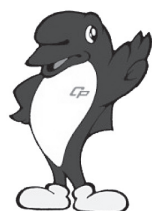
千葉県警察マスコットキャラクター シーポック