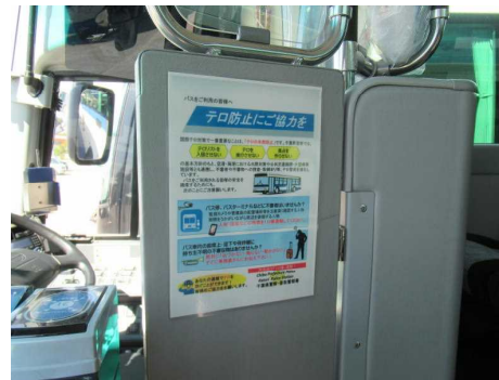
【ポスター掲示による広報（バス内）】