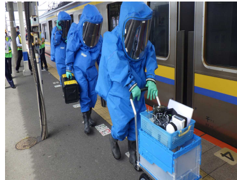
【NBCテロ訓練実施状況】