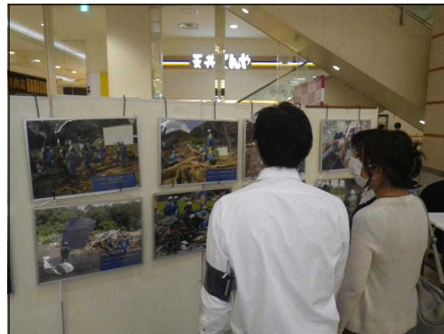
【広報啓発活動実施状況】