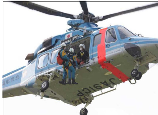
【合同訓練実施状況】