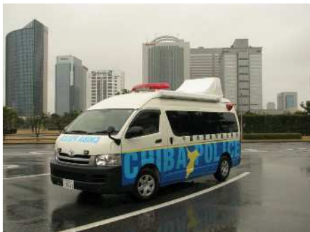
【ワンボックスタイプ】

A 移動交番車は、その名のとおり「動く交番」です。専用の車でお年寄りや子供たちを見守りながら町中のパトロールをしたり、地域の人たちがたくさん集まる場所や交番を新しく建ててほしいという場所などに車を止めて、事件・事故や落とし物の届出を受けたり、みなさんの相談を聞いたりするなど、交番と同じ活動を行っています。