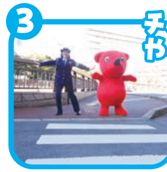
くるまがきていたら、 とおりすぎるまで