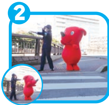
くるまがきていないか みぎ、ひだりを