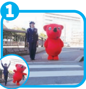
どうろをわたるまえに