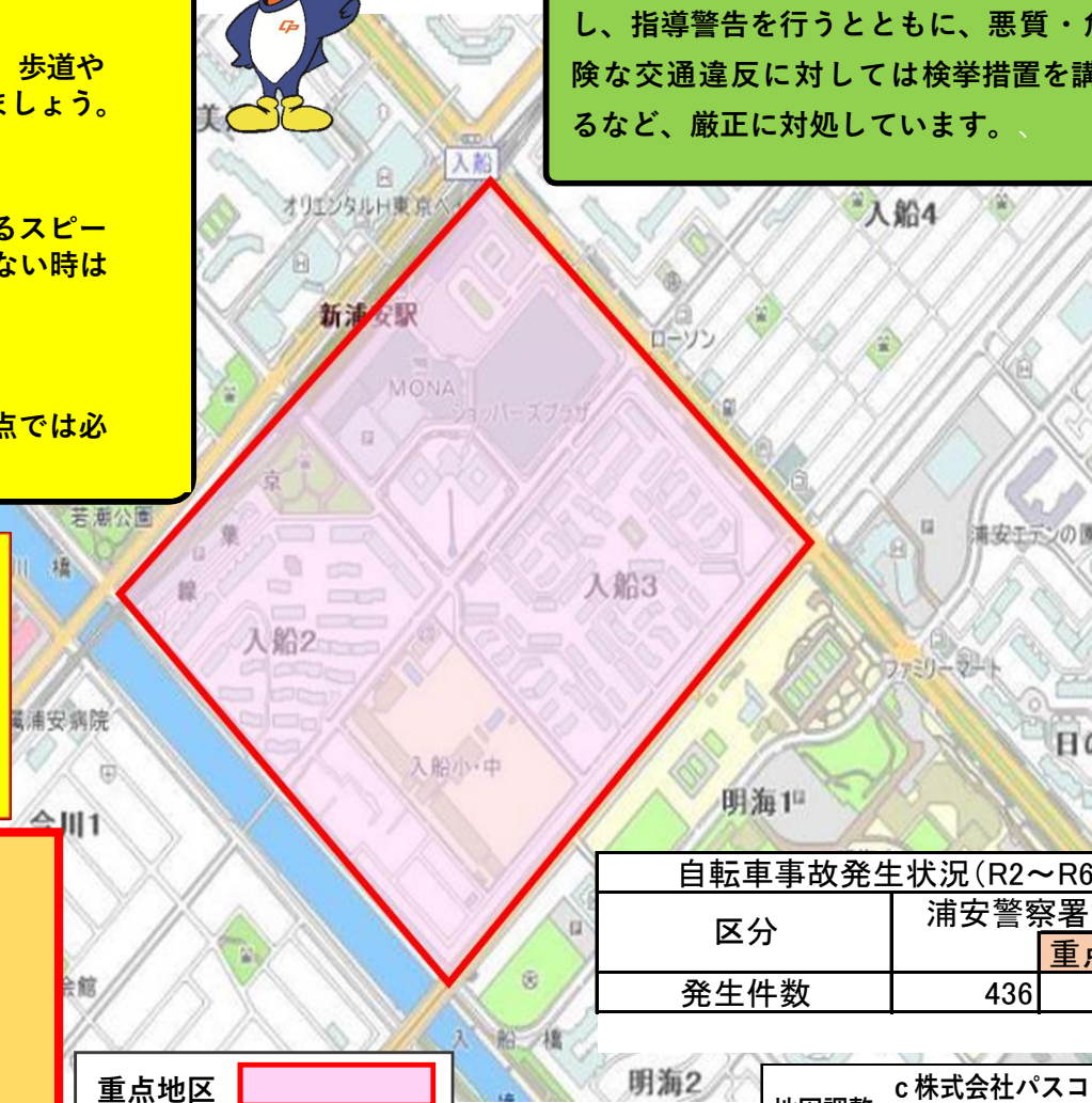
自転車事故発生状況(R2～R6)