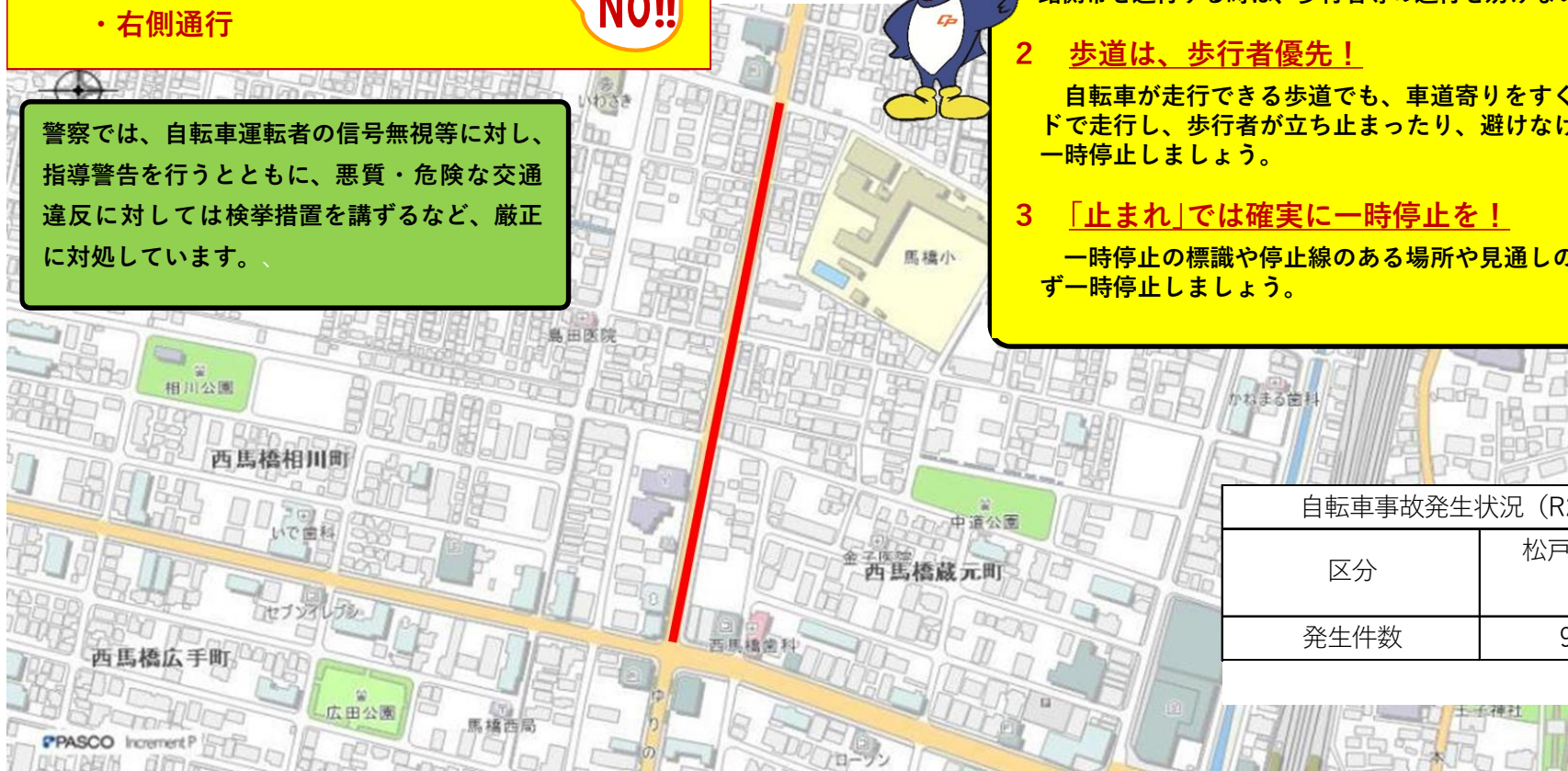
自転車事故発生状況（R2～R6）

一時停止の標識や停止線のある場所や見通しの悪い交差点では必ず一時停止しましょう。