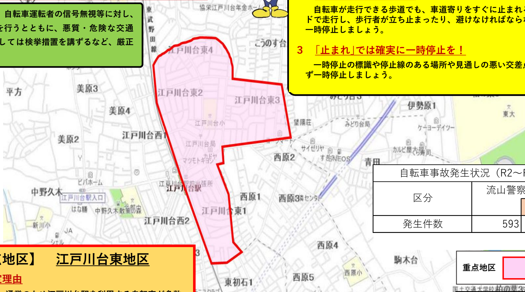
自転車事故発生状況（R2～R6）

警察では、自転車運転者の信号無視等に対し、指導警告を行うとともに、悪質・危険な交通違反に対しては検挙措置を講ずるなど、厳正