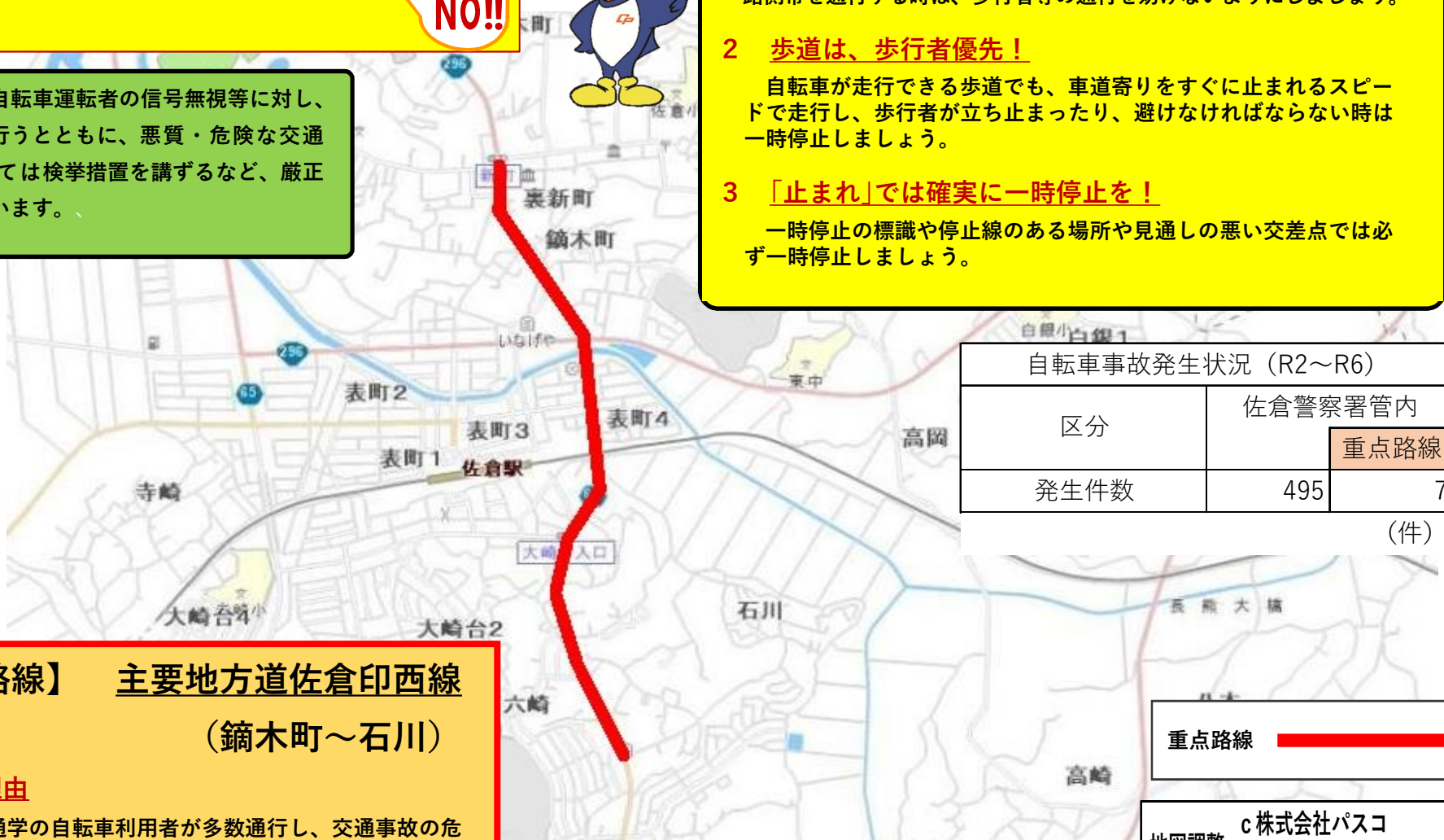
自転車事故発生状況（R2～R6）

一時停止の標識や停止線のある場所や見通しの悪い交差点では必ず一時停止しましょう。