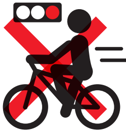
信号無視【反則金 6,000 円】