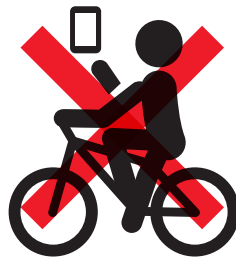
ながらスマホ【反則金 12,000 円】 (保持)