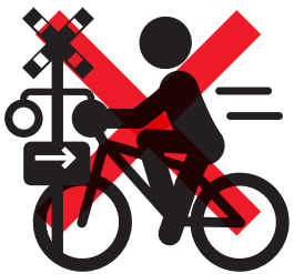
遮断踏切立入り【反則金 7,000 円】