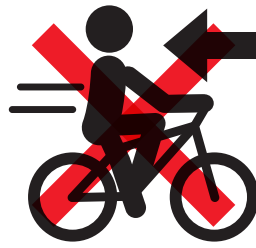
右側通行【反則金 6,000 円】