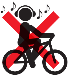
ヘッドホン(イヤホン)【反則金 5,000 円】 ※音量を上げ音楽を聴く等、安全な運転に必要な音声が聞こえないような状態にすること。