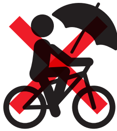
傘さし運転【反則金 5,000 円】