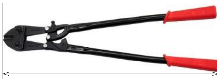
ボルトクリッパーの「長さ」

なお、ラチェット機構を備えているボルトクリッパーは、現時点、国内でほとんど流通しておらず、また、唯一警察庁で把握している製品も全長が75センチメートルを超えていることから、独立した要件としては設けていない。