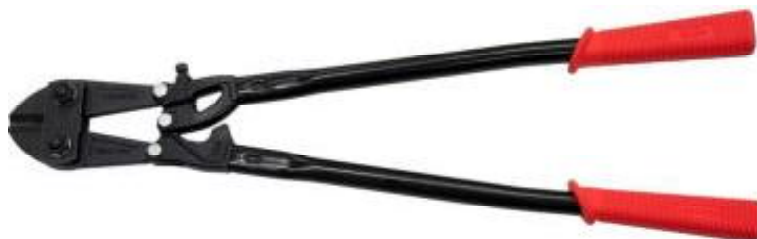
手動両手式のボルトクリッパー

なお、ボルトクリッパーという商品名で販売されていなかったとしても、鉄筋等の鋼材を切断するための工具として設計、製造又は販売されているものについては、ボルトクリッパーに該当する。