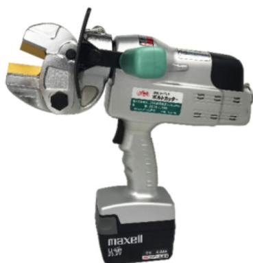
電気装置及び油圧装置を備えたボルトクリッパー