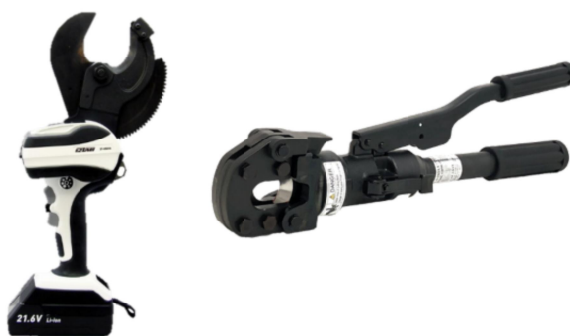
(左) 電気装置を備えたケーブルカッター